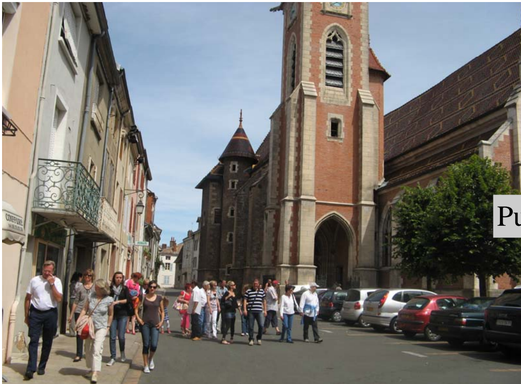
Puis de l'Eglise Saint-Pierre